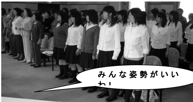
みんな姿勢がいいわ!

ジュニアの部と一般の部に分けて講習がありました。ジュニアの部では、小さい子も一生懸命練習していました。