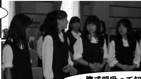
←中学生もがんばりました!