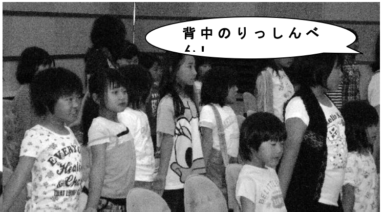
背中のにっしんべん!