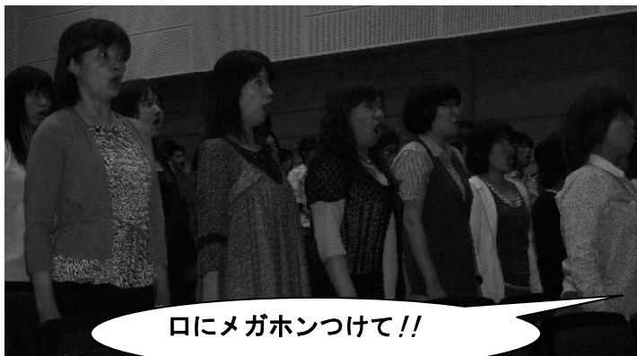
口にメガホンつけて!!