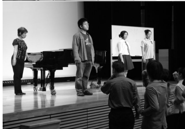
(写真上段/高梁会場 下段/岡山会場)