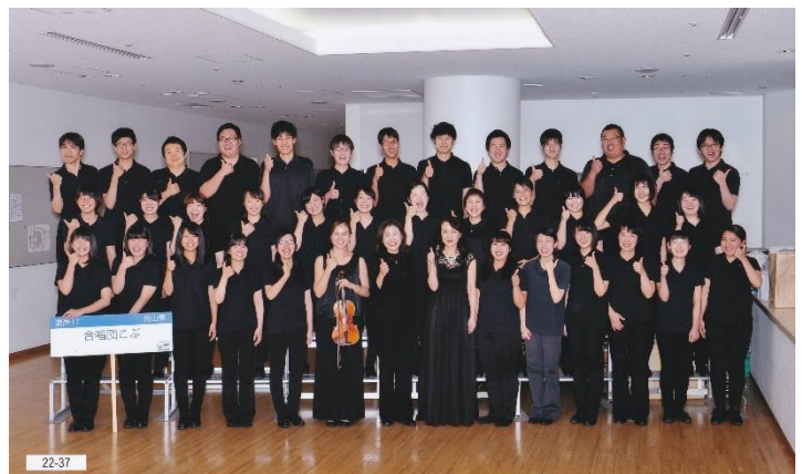
22-37 全日本合唱コンクール 第70回 全日本合唱コンクール全国大会 大学職員 教職員 2017年11月25日(土) 26日(日) 会場 東京芸術大学コンサートホール

それでも、改めて楽譜と向き合い、多くの先生方からご指導をいただきながら、完璧ではなくとも、求める「答え」に限りなく近づくための、良い練習を重ねられたように思います。